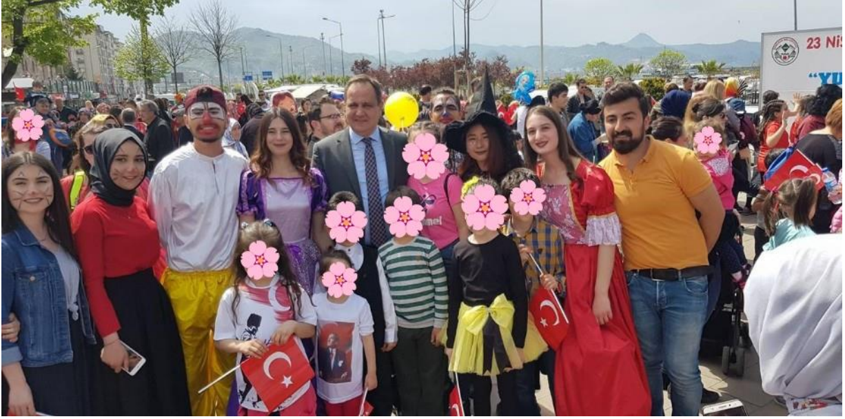
3- Motivasyon olsun dedik Yaylalara Çıktık.